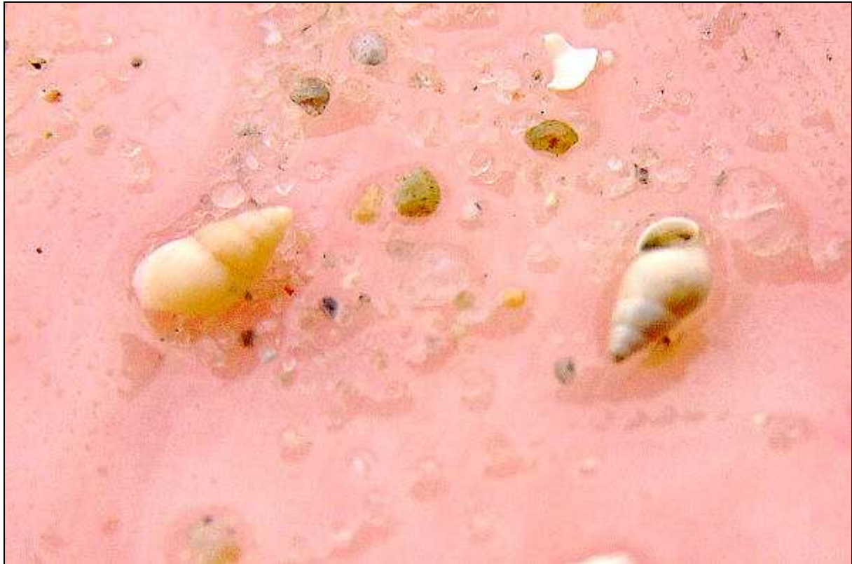
Abb. 3: Schnecklie