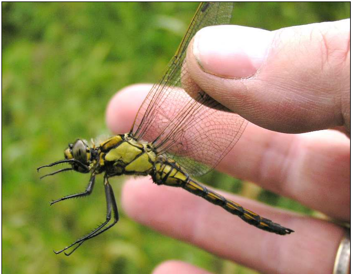
Abb. 5: Großer Blaupfeil Orthetrum cancellatum (L. 1758) am 03.07.04 am Treptow-See

Häufigkeit: H1 (auch eine Larve am 03.07.04 gekeschert) Nicht gefährdet.