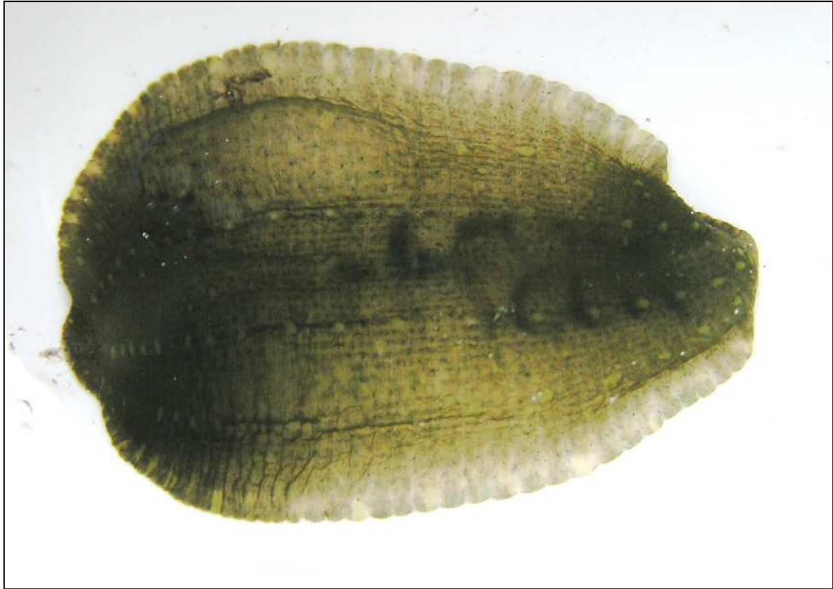
Abb. 4: Gemeiner Enteneigel ( Theromyzon tessulatum )

Die Egelfauna des Sees ist arten- und individuenarm, vermutlich wegen der mesotrophen Wasserqualität. Nur Erpobdella octoculata trat lokal häufiger auf. Theromyzon tessulatum war vereinzelt zu finden. Da der See für Wasservögel bedeutsam ist, hat er gute Nahrungsvoraussetzungen. Am eutrophen Abfluss des Sees traten vermehrt Erpobdella octoculata und Theromyzon tessulatum auf. Nur hier wurden Helobdella stagnalis und Glossiphonia complanata gefunden. Seltene oder bemerkenswerte Arten konnten im See nicht nachgewiesen werden. Der Sumpfbereich östlich des Sees ist Lebensraum von Erpobdella testacea , die in temporären Gewässern bzw. analogen Verlandungsbereichen ihr Optimum besitzt.